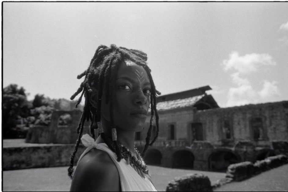
Mirada al pasado, Africa y todo lo que se deja atrás