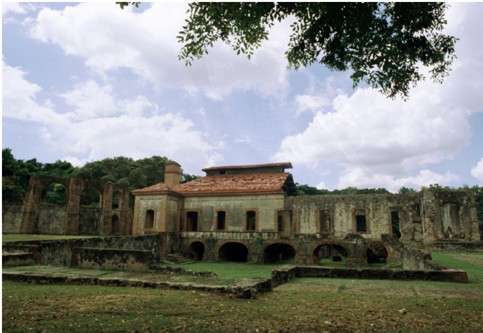
Reconstrucción de la memoria fotoquímico a color.